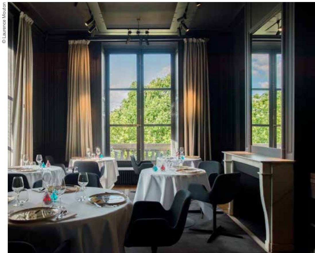
Restaurant Guy Savoy, salon Scènes de Paris