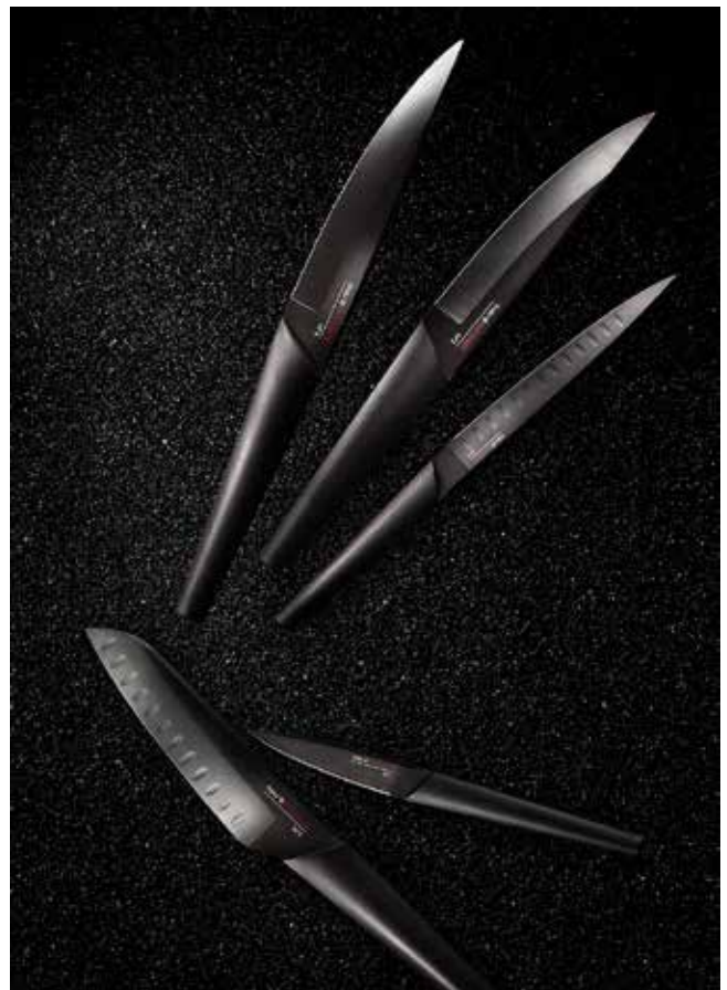
Tasse surprise et le couteau Thau dessinés par Bruno Moretti pour Guy Savoy