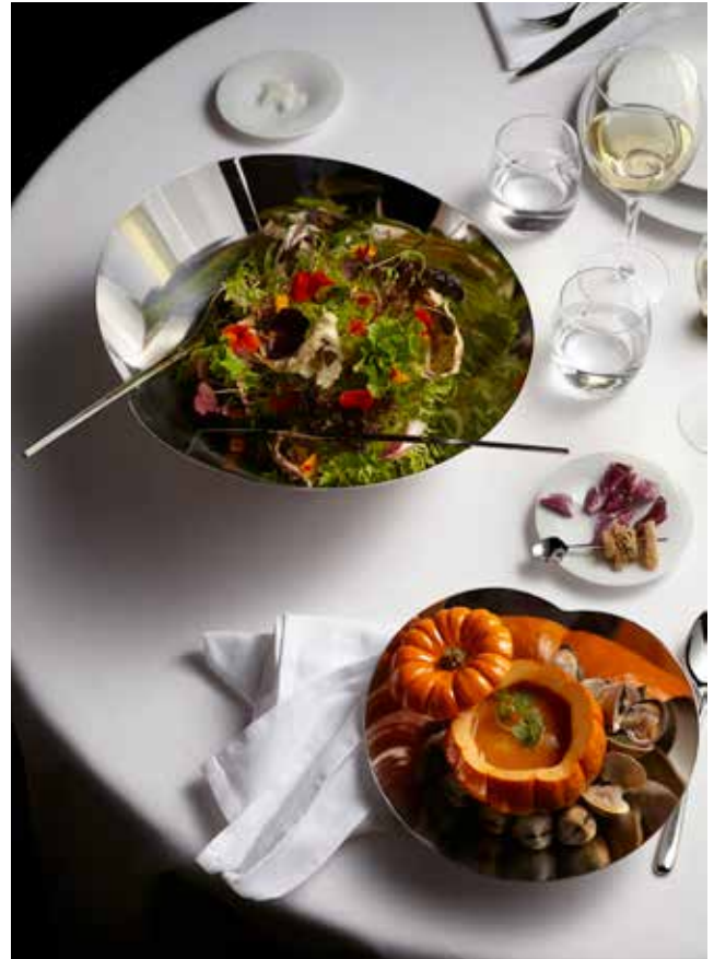
Human collection Alessi dessinée par Bruno Moretti pour Guy Savoy