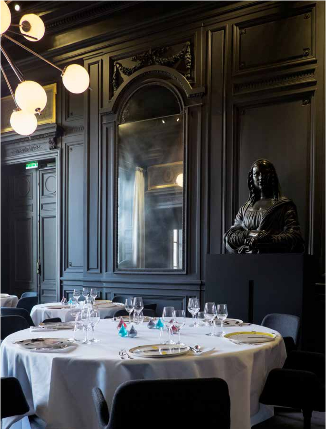
Restaurant Guy Savoy, salon Belles Bacchantes