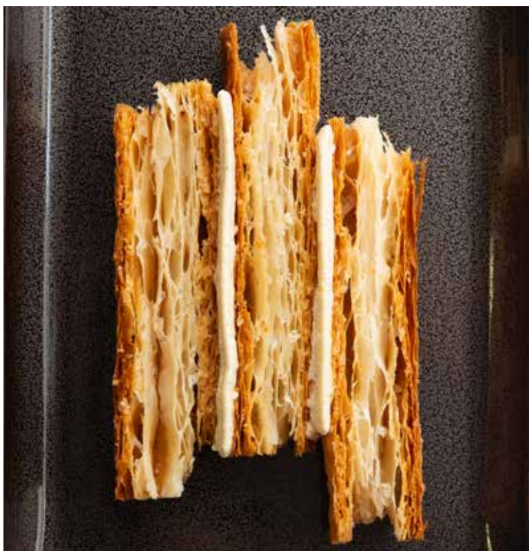
Mille feuilles ouvertes à la vanille de Tahiti