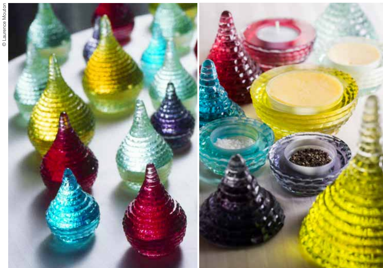
Gouttes d'Eau par Laurent Beyne pour Guy Savoy