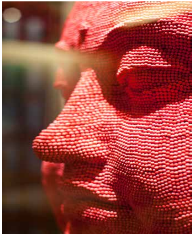
Tête de Bouddha, David Mach, 2007