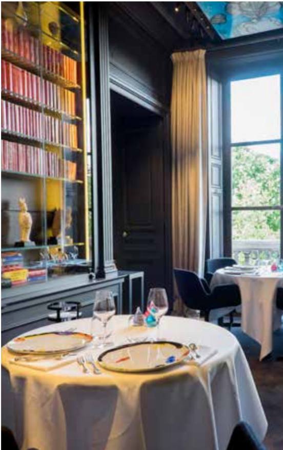
Restaurant Guy Savoy, salon Bibliothèque