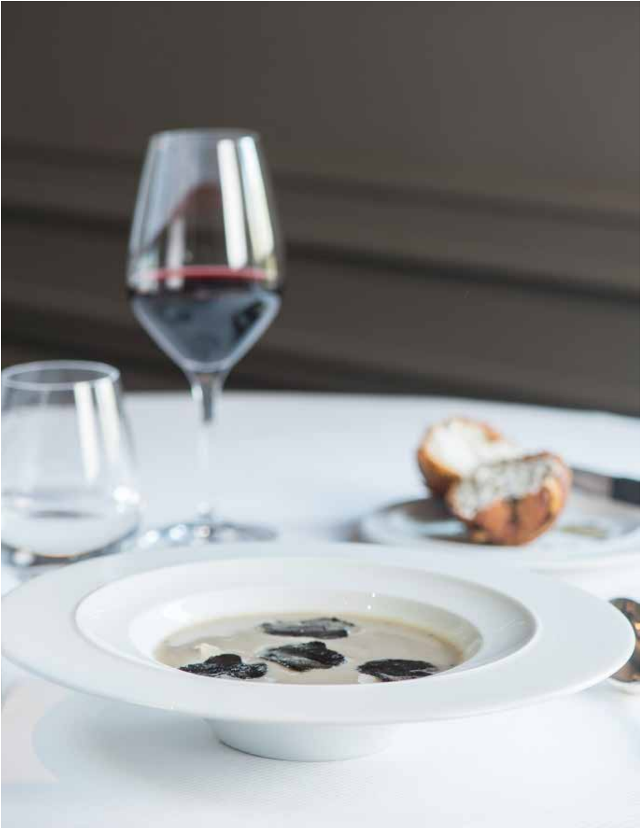
Soupe d'artichaut à la truffe noire, brioche feuilletée aux champignons et truffes