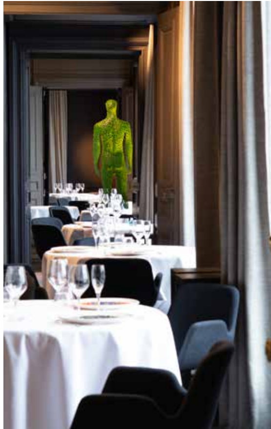
Restaurant Guy Savoy, les salons en enfilade

Recouvertes de grandes nappes blanches et garnies tour à tour de cristal, de porcelaine, d'acier et d'objets d'artistes en verre taillé ou en céramique peinte, elles sont des scènes de théâtre qui captent toute la lumière.