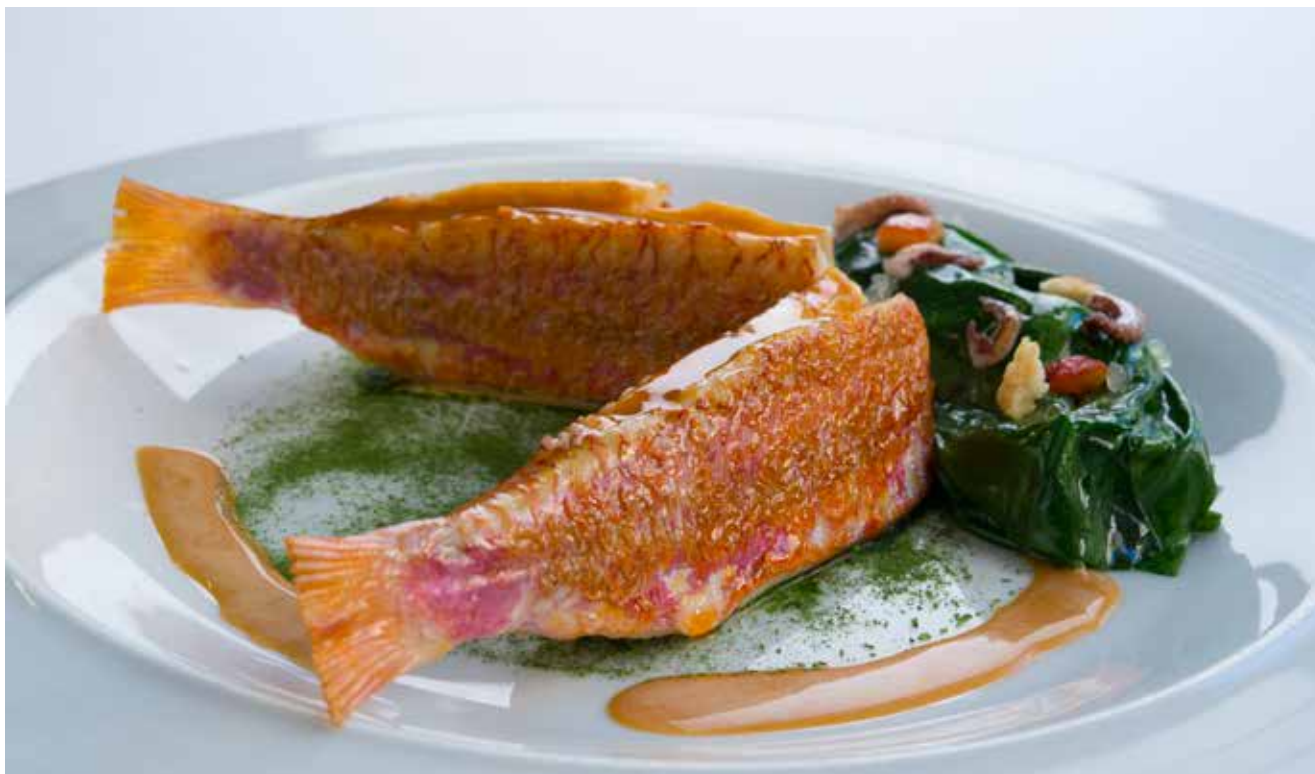
Rouget barbet en situation, la mer en garniture