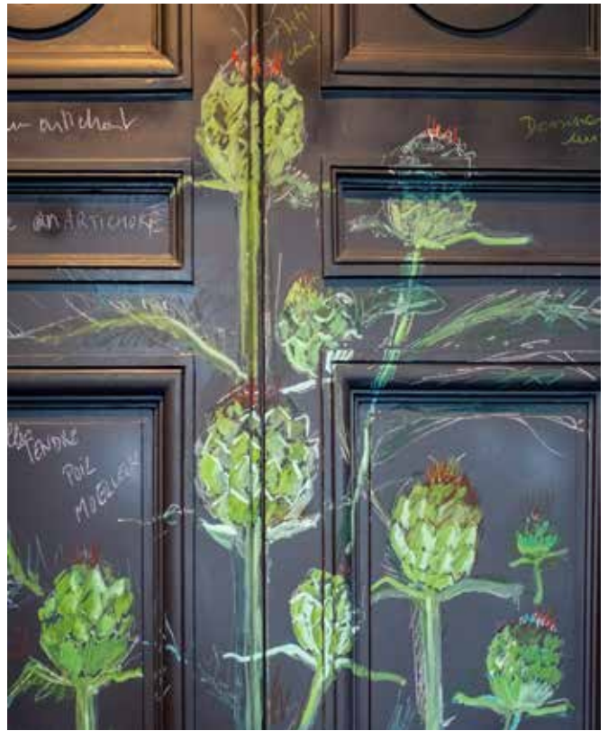
Artichauts (Dessine-moi un artichaut), Fabrice Hyber, 2018