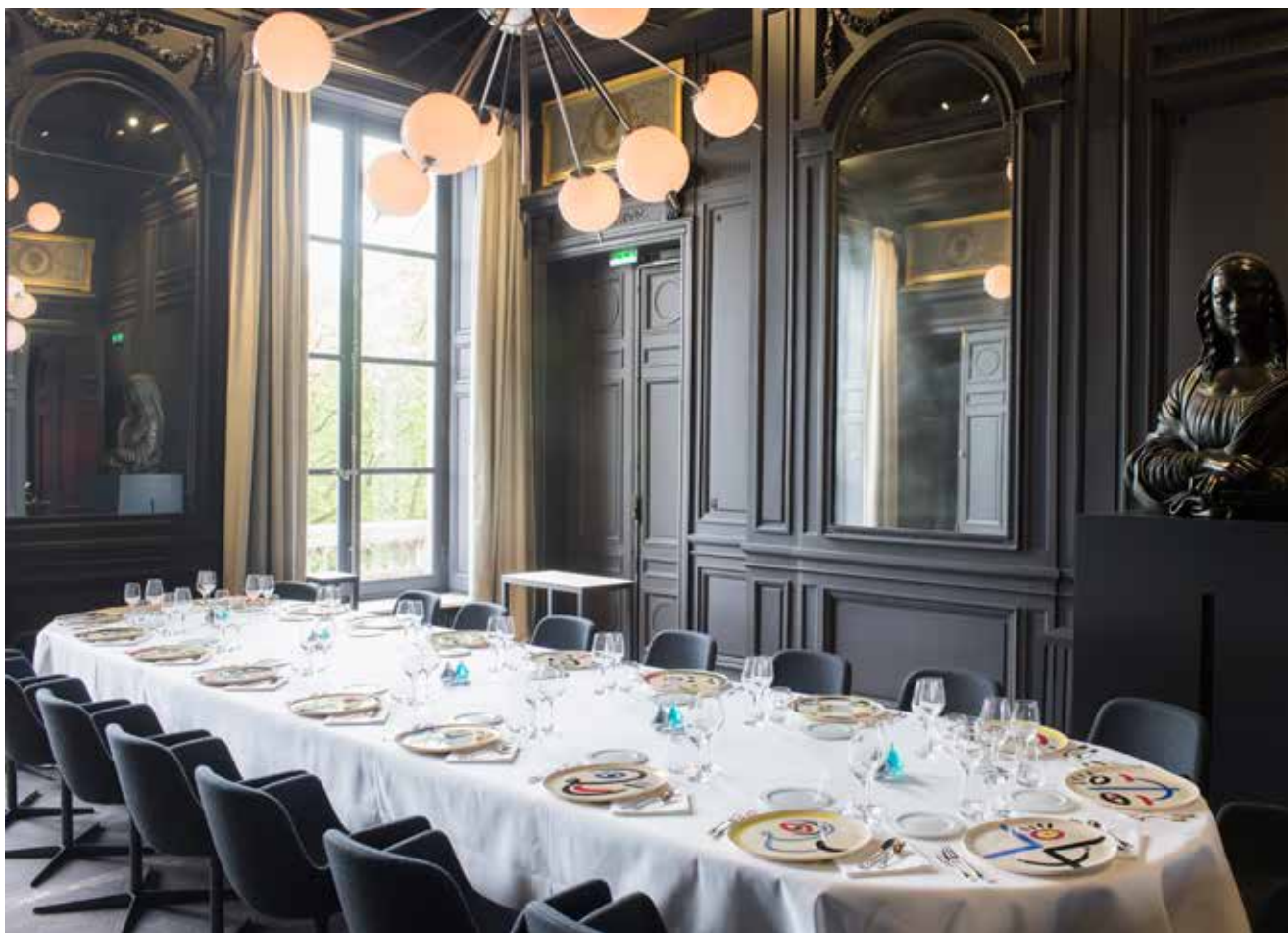
Restaurant Guy Savoy, salon Belles Bacchantes