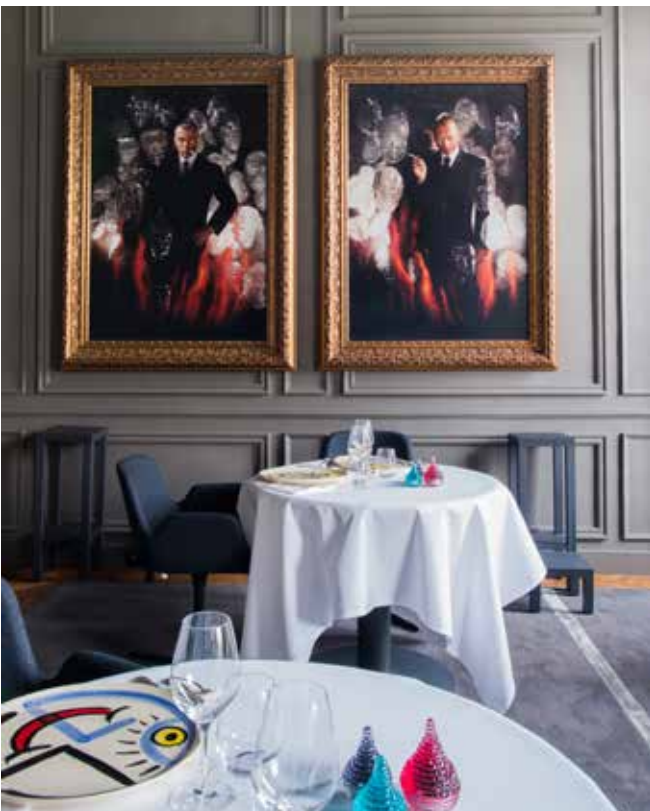
Autoportrait à la cigarette, Pierre et Gilles, 1999