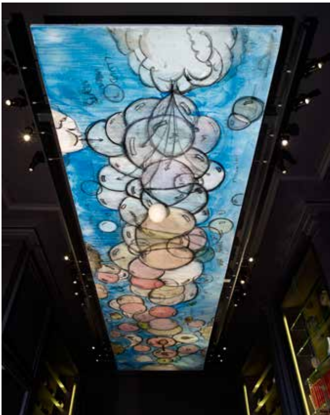
Effervescence, Fabrice Hyber, 2015